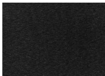
Aluminium noir Dukometal