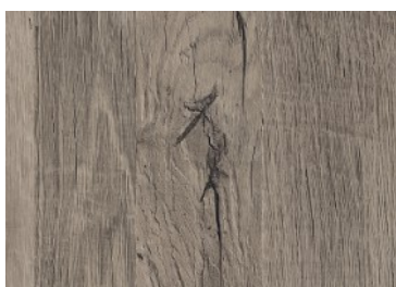
Bois noirci Bauwerk