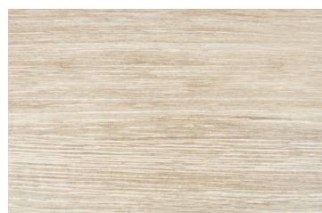
Chêne clair Chêne clair