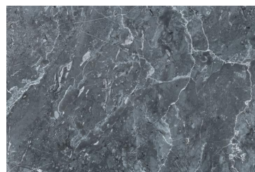
Marbre antracite Marbre antracite