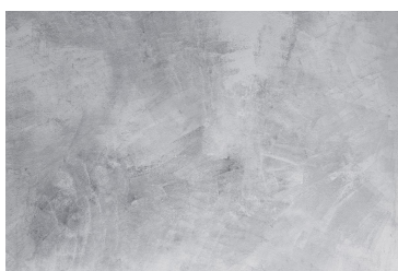
Béton ciré Béton ciré